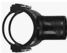
PE - Anbohrschelle